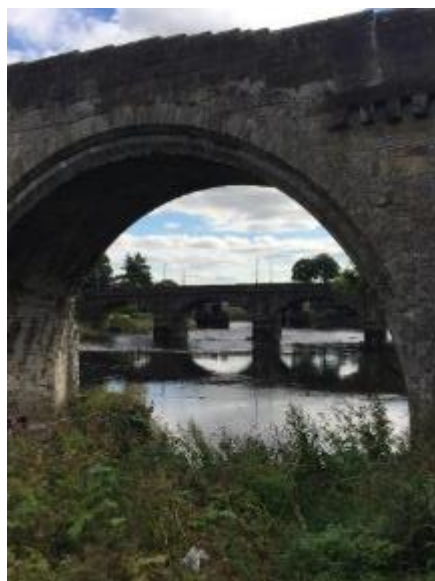
橋下可以看見橋中橋