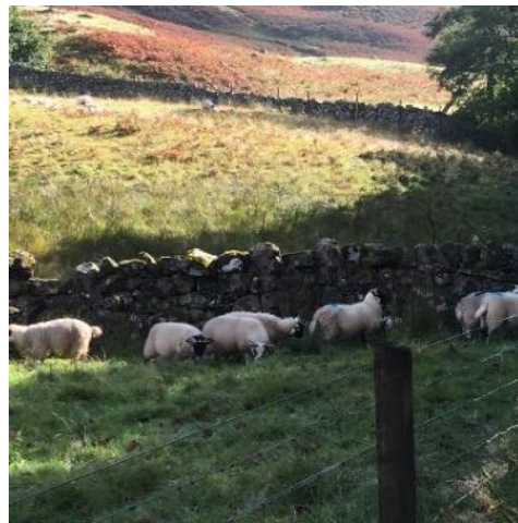
一路前往，總見羊群