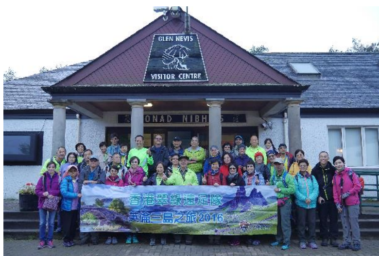
登山前，在資訊中心前齊齊合照。

她拿出一個鎖匙包，逐一去嘗試開門，當然是白費心機啦！我一向都有點失物恐懼症，重要物品全部不離身，所以我背包內的水、風衣、帽子都要與外子分享！他沒有水、沒有食物、沒有行山杖、沒有外衣，什麼攻頂的設備都沒有，只好乖乖跟著我吧！（司機 Gordon 很善心，見他可憐，便借了件外衣給他。）