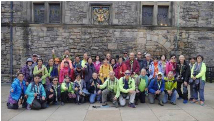
在蘇格蘭戰爭紀念館的門前，也不可以拍照，又不可用 banner，只好在另一角落拍團體照片