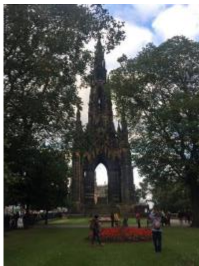
Rose Garden 旁的高塔

今天最後一景點是 Rose Garden，而晚餐地點 Mercure Hotel 就在附近。可能我沒有走得太遠，Rose Garden 並沒有看到玫瑰，反而見到一個高塔，應當是當地的地標，不過上塔需付費，況且附近的商場似乎較為吸引。我走進了一間很有規模的馬沙 Marks & Spencer，逛不了多久，到集合用晚餐的時間才離開。