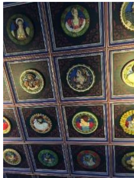
辦公室內的天花板