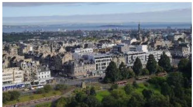
城堡位於高處，四周都可見到腳下的城鎮，甚至遠眺北海