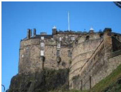
下車後，向上望，城堡外貌。