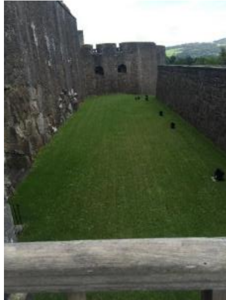
城堡建於峭壁上，防禦力很強。正前方有護城河，現時已沒有河水，只有青草。