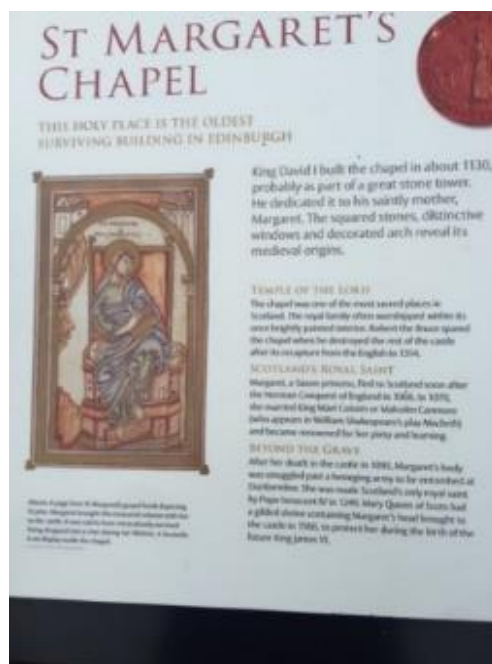
城堡內有一間聖瑪格麗特小教堂，是 King David I 建於 12 世紀，用以紀念他的母親。這教堂小得只能容納二、三十人，是最古老及倖存在城堡內的建築物。17 世紀時，曾用作軍火庫，直至 19 世紀才恢復原狀，在那六個小窗放回彩圖玻璃。現今多用作婚配禮儀。