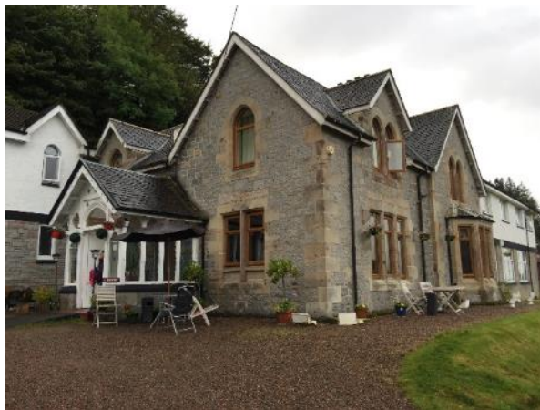
百無的 Innseagan House