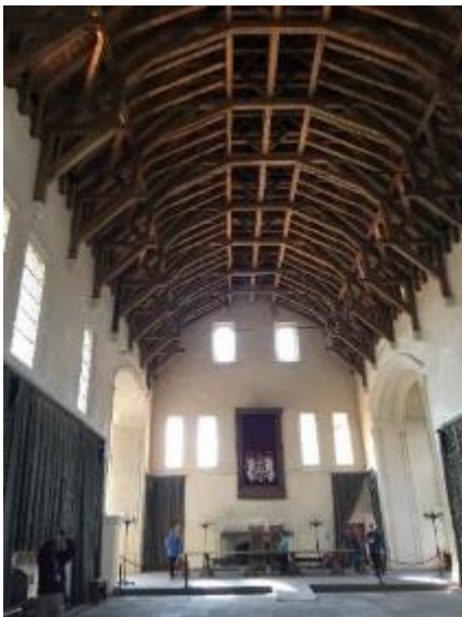
御用大客廳，留意天頂，猶如做船一樣，又不用一口釘