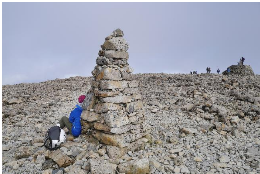
以上都是登頂隊友的照片