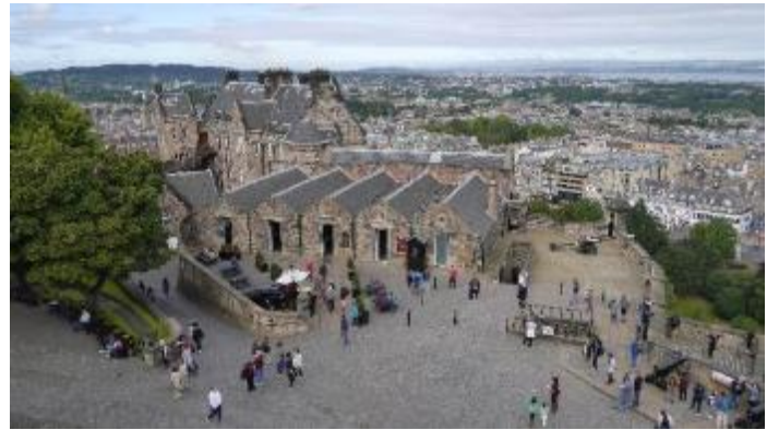
城內，戶外是可拍照，所有戶內都不容許拍照