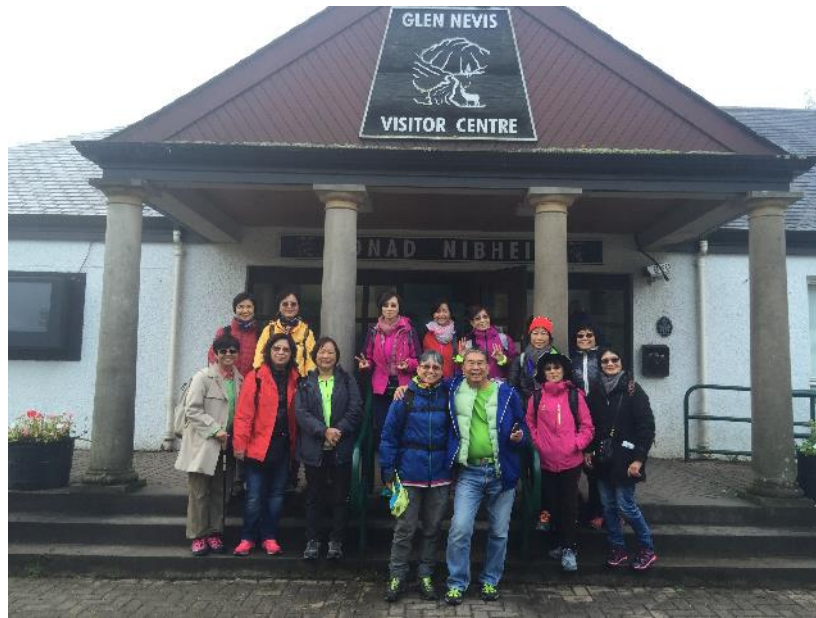
已決定不會攻頂的小組（一男十三女）