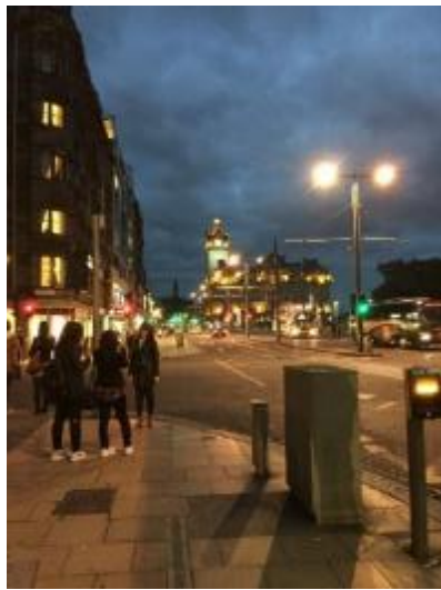
晚飯後出來的街景