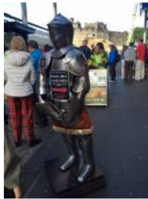
過舊城，向城堡走去。